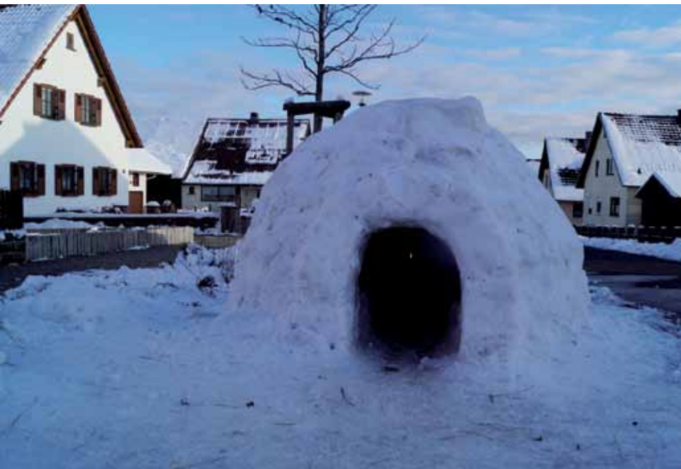
Der Permakulturverein Waldgeister e.V. hat in Waldberg in der Premicher Straße ein Iglo gebaut.