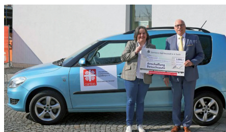
Caritasverein Sandberg konnte Fahrzeug dank Spenden anschaffen: Besuchsauto soll soziale Teilhabe stärken

Fälligkeiten von Gemeindeabgaben und Steuern Die 2. Rate der Gemeindeabgaben (Grundsteuer, Wasser- und Kanalgebühren, Gewerbesteuer) ist am 15. Mai fällig. Soweit sie keine Abbuchungsermächtigung erteilt haben, sorgen Sie bitte dafür, dass der im Bescheid genannte Betrag rechtzeitig überwiesen wird.