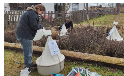
Eklettoren an Staudenflächen

Weitere Informationen zum Projekt und wildbienenfördernden Maßnahmen unter https://www.dorfbienen.biozentrum.uni-wuerzburg.de/SecondPhase.aspx