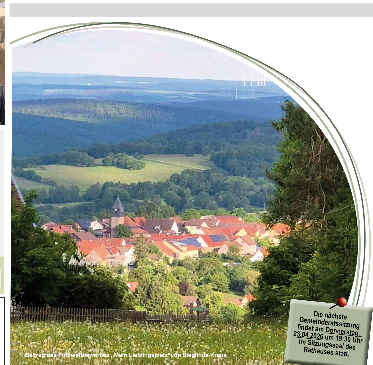
Beitrag des Fotowettbewerbes „Mein Lieblingsplatz“ von Siegfriede Kraus

Bürgermagazin für die Gemeinde Sandberg | Kilianshof | Langenleiten | Schmalwasser | Waldberg | mit Nachrichten aus dem Rathaus